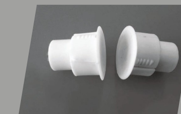
Sensori per antifurto